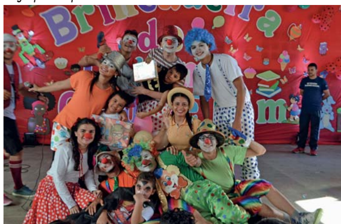
Voluntários que se vestem de palhaço para a alegria do público