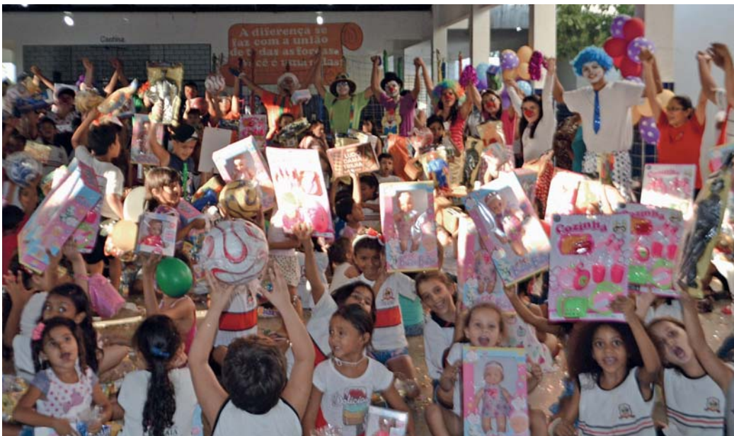
As crianças ganharam diversão, brinquedo e lanche na festa promovida pela Empresa Vitória

Voluntários da Empresa Vitória, alguns vestidos de palhaço, fizeram a alegria de 162 alunos da Escola Monsenhor André Viana Camurça em comemoração ao mês da criança.