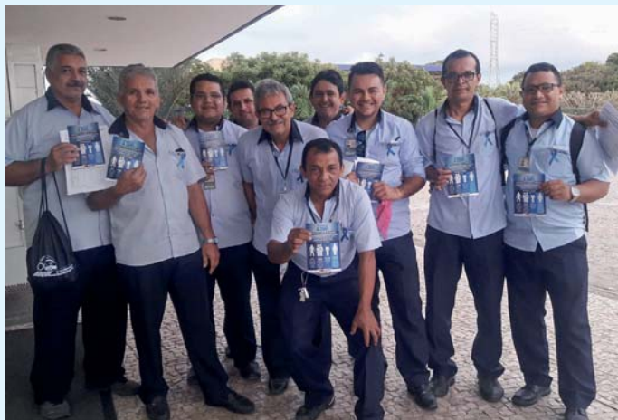
Os colaboradores da Operação também apoiam o movimento

No Brasil, o câncer de próstata é o segundo mais comum entre homens, ficando atrás apenas do câncer de pele (não melanoma). A prevenção e o diagnóstico precoce devem ser feitos através de consulta ao médico urologista, que é o profissional habilitado a orientar sobre a melhor