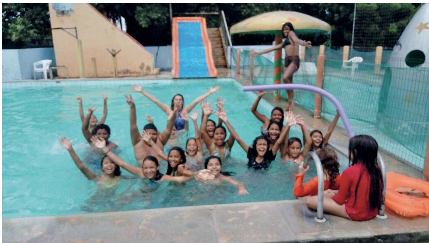
As crianças se divertiram no banho de piscina