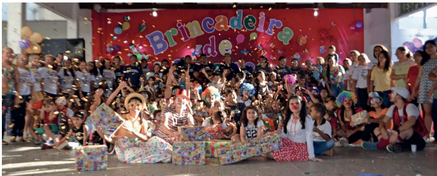
Voluntários, profissionais da Escola Monsenhor André Viana Camurça e alunos beneficiados

A Festa da Criança para 162 alunos da Escola Monsenhor André Viana Camurça, no bairro Araturi, foi um sucesso. Graças a participação dos colaboradores da Vitória e diretoria da Empresa, na campanha “Uma atitude por um sorriso”.