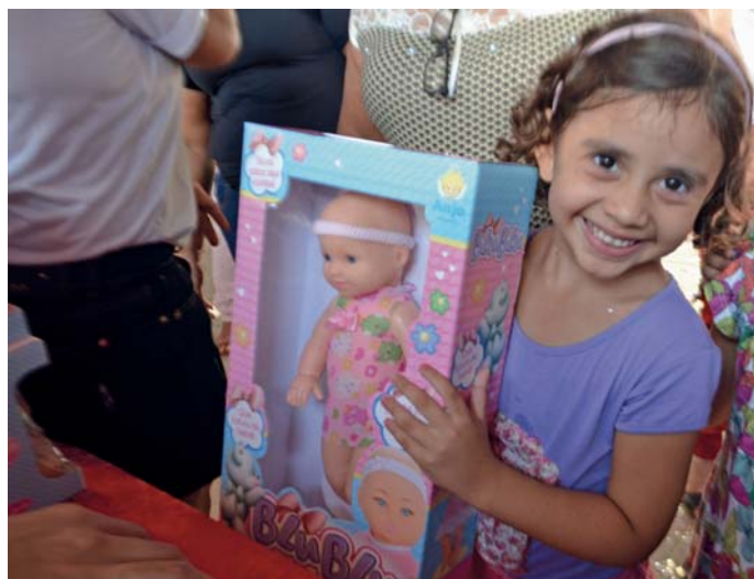
Alegria pelo brinquedo recebido