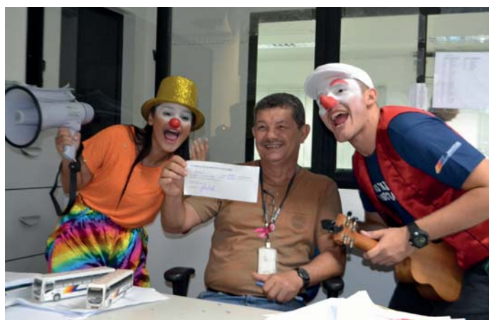
Adesão dos colaboradores à campanha “Uma atitude por um sorriso”