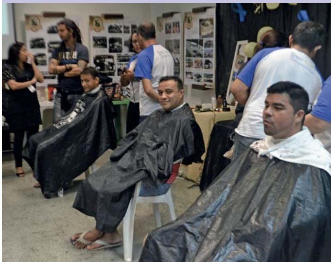
O auditório foi adaptado para a realização dos cortes de cabelo

A Vitória, em parceria com o Senac, promoveu, nos dias 8, 9 e 10 de novembro, corte de cabelo para os colaboradores do sexo masculino. O evento, acontecido no auditório Eliezer Guimarães, faz parte das ações voltadas para a qualidade de vida dos funcionários da Empresa.