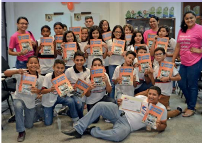
A pose para oficializar a visita à Empresa Vitória

Os alunos da Escola Dona Lavínia de Medeiros, participaram do Programa Criança no Mundo da Vitória no dia 26 de outubro último. Na oportunidade, conheceram a história, instalações e funcionamento da Empresa. Também visitaram a Horta Medicinal e aprenderam sobre os cuidados necessários para manutenção do planeta, a partir das práticas realizadas na Empresa Vitória.