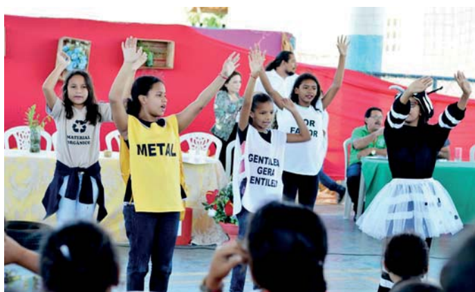
Grupo de Teatro durante apresentação do mix das peças

Uma das atrações culturais do evento foi a participação do Grupo de Teatro, Conscientização e Arte do Projeto Respirando Ar Puro.