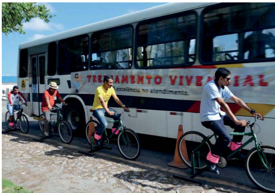
Motoristas vivenciam o cotidiano do ciclista no trânsito