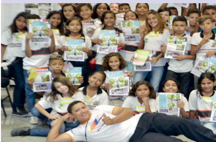
Alegria das crianças com os brindes ganhos durante o passeio

O Programa Criança no Mundo da Vitória recebeu os alunos da Escola Danilo Sá, no dia 31 de agosto último.