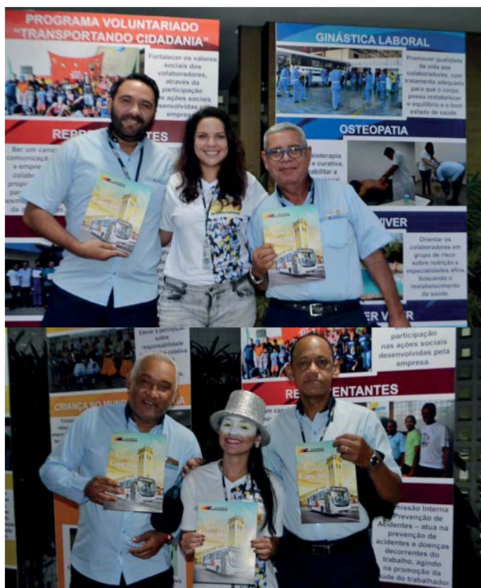
Alegria e satisfação na entrega da revista “Vitória de Caucaia”