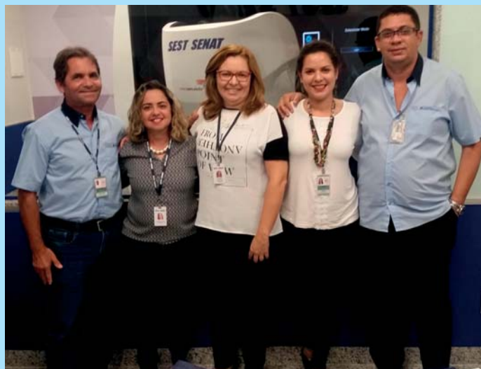
Colaboradores da Vitória com profissionais do Sest Senat

“Localizados em Unidades Operacionais distribuídas por todo o Brasil, os 60 simuladores têm o objetivo de treinar mais de 50 mil motoristas no período de três anos.”