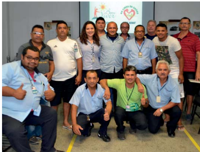
Colaboradores com a gerente do DH durante uma das palestras de conscientização de doenças crônicas como diabetes, hipertensão, problemas osteomusculares e obesidade. Também contamos com a adesão espontânea, buscando a promoção da saúde”, acrescenta.

“É importante destacar que a principal meta é que nossos colaboradores tenham informação e aparato suficiente para esta mudança. O emagrecimento é consequência, mas pode acontecer junto com a conquista de uma melhor qualidade de vida. Todos os que participaram destes encontros foram triados através dos prontuários e atestados médicos, onde detectamos