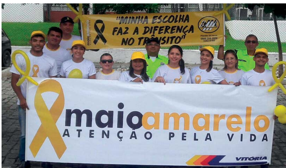
Colaboradores e integrantes da AMT usam camisetas temáticas para chamar a atenção sobre a campanha

São três mil vidas perdidas por dia nas estradas e ruas ou a