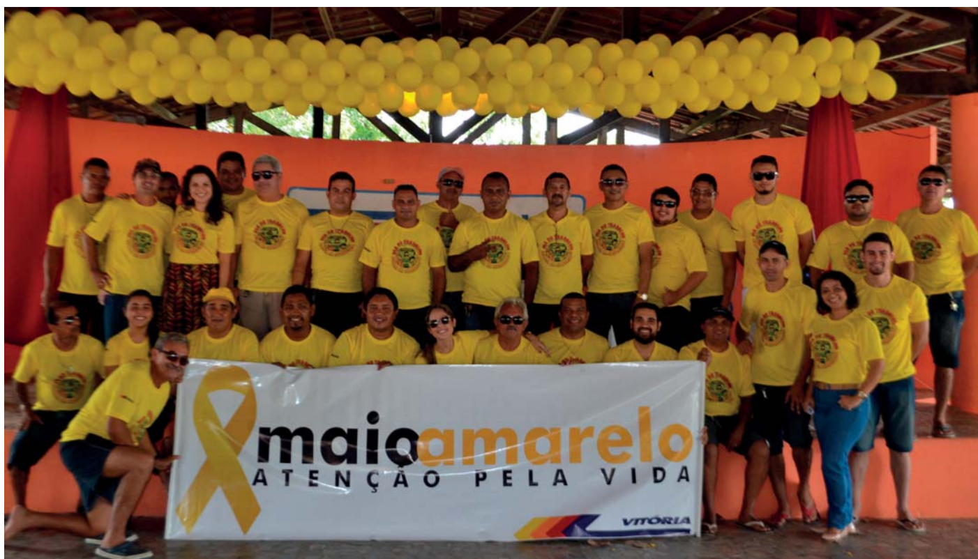
Gestores e colaboradores oficializaram a campanha "Maio Amarelo" durante a comemoração do Dia do Trabalhador, no 1º de maio

INFORMATIVO DA EMPRESA VITÓRIA - TIRAGEM 800 EXEMPLARES VENDA PROIBIDA - ANO XXII- Nº 5- MAIO/2017 - CAUCAIA - CEARÁ