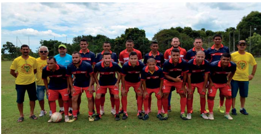
O time da Vitória que competirá na Copa Sest Senat 2017