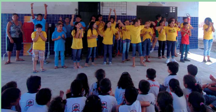
Apresentação da peça sobre Maria da Penha

No dia 17 de março os atores apresentaram a peça: "Mulher - Maria da Penha: uma história, uma vida". Em 12 de abril apresentaram "Um homem chamado Jesus, nosso salvador", por conta da Semana Santa. No dia 12 de maio, uma peça sobre as mães.